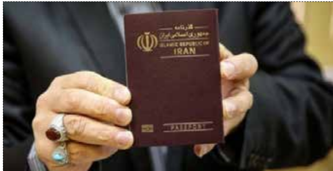
معاون قالیباف به خاطر مشکل ویزا، در کویت بازداشت شد

طبق اعلام پزشکی قانونی روزهای هفتم شهریور با ۸۳ نفر، ششم شهریور با ۷۹ نفر و بیست و چهارم شهریور با ۷۸ نفر پر تلفات ترین روزهای سال ۹۳ بوده‌اند.